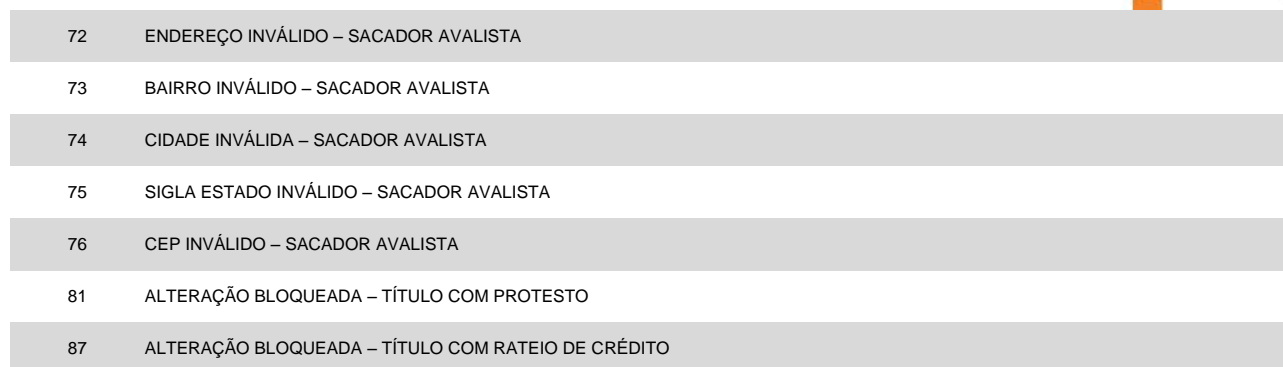
TABELA 3 – Instruções rejeitadas (código da ocorrência = 16 na posição 109 a 110)